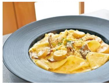
看板メニューのホルチーニ香る生パスタ〜濃厚クリームソース〜。キノコの芳醇な香りももちもち麺に絡み絶品。