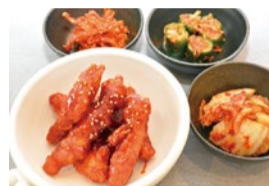
本場のキムチに甘辛ヤンニョンチキン。癖になる辛さで何度でも食べたい。

／ 特典 シティライフを見たで バニラアイスクリームサービス (ランチタイム1グループ4名まで限定、8月末まで)