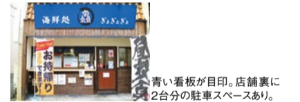
青い看板が目印。店舗裏に2台分の駐車スペースあり。

市場直送の新鮮な魚介類が楽しめる海鮮処「轟 ぎよぎよぎよ」!8月のオススメはエビと夏野菜の串カツが楽しめる「夏勝定食」。鯉の蒲焼、日替わり刺身に夏野菜3本&エビ2本の串カツが付く。また、8月限定で人気のランチメニュー通常1,320円が1,100円に!平日の曜日別にメニューが変わるので、詳しくは下記メニューをチェック!