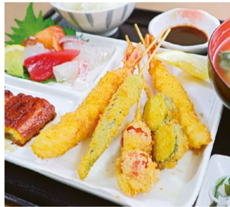
(上) 鯉に夏野菜とエビの串カツがつくスタミナ満点の「夏勝定食」(1,980円)。ご飯、あら汁、酢の物付き。 (左) 8月は平日の曜日別おトクなランチメニューにも注目したい。ボリュームがある人気の「海鮮丼」は月曜日に登場!