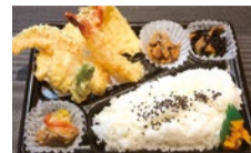
6種の天ぷら弁当...1,080円

本日の焼魚、有頭えびフライ、お魚メンチ、ほたてフライ、しぐれ煮、漬物+本日のおかず3種