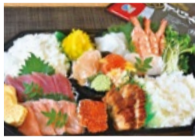
手巻き セット (3人前) 3,680円

本日の焼魚2種、鯖ハラミ唐揚げ、天ぷら(天然えび、キス、ほたて、野菜2種)、煮物(あわび旨煮、極み海老旨煮、いか旨煮、里芋、南瓜)、サラダ(さば味噌ポテトサラダ)、自家煮いなり寿司(あさりしぐれ煮3個、ひじき煮3個)