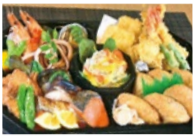
オードブル セット (2~3人前) 4,100円