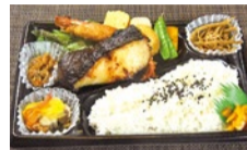
銀だら西京焼き弁当...1,410円