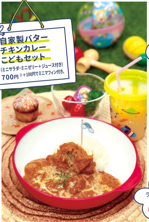
大人はこのメニュー 自家製バターチキンカレー こどもセット (ミニサラダ・ミニゼリー+ジュース付き) 700円 ※+100円でミニマフィン付き。