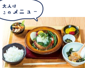
大人はこのメニュー 合挽きハンバーグ -和風鬼おろしポン酢-(200g) 1,580円 自慢のハンバーグには九州産黒毛和牛、鹿児島産・霧島黒豚、米は宮城県産ひとめぼれを使用。みそ汁は味噌の種類も複数で選べる「味噌玉」。サツマイモやだして煮込んだ大根も美しい。