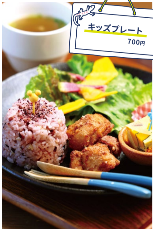
大人はこのメニュー キッズプレート 700円

「医食同源」をテーマとした古民家カフェ。唐揚げがメインの「キッズプレート」は大人と変わらない味付け。薬膳スープ、酵素ドレッシングをかけたサラダや旬の野菜を使った副菜などがつき、地元農家の無農薬野菜も多く使うなど栄養たっぷり。座敷もあるので、近隣の親子連れが多く訪れる。