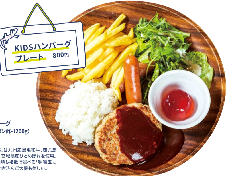
大人はこのメニュー KIDSハンバーグ プレート 800円