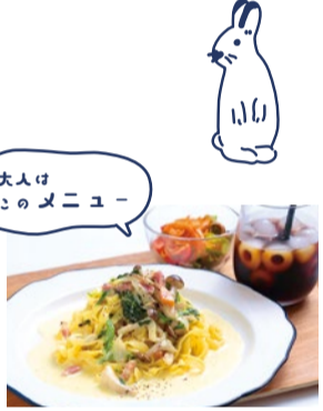
大人はこのメニュー 淡路麺業の生パスタおとなセット (ミニサラダ+コーヒー+紅茶付き) 1,300円 オーナーが惚れ込み淡路島から取り寄せる生パスタを使った絶品クリームパスタ。もちもち食感が大人気。

特典 「シティライフを見た」で ランチ利用でもカフェ利用でも 総額から 10%OFF 自家製ミニマフィンサービス (8月末まで)