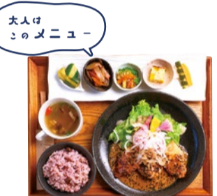
大人はこのメニュー 健康ひふみ定食 1,000円 いつでも10種類以上の野菜を使い、メインやサラダと一緒に5種類もの副菜がついて見た目も舌も大満足の人気ランチ。薬膳の第一人者が考案した名物の薬膳スープは2種類から日替わりで登場。

特典 ランチ注文で、 ドリンク1杯サービス (アイスコーヒー、アイスティー、オレンジジュースの中から) (8月末まで)