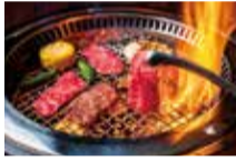
牛楽 箕面店 (キュウラク ミノオテン) 箕面市外院1丁目2-9