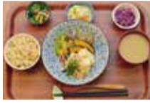
野菜とつぶつぶ アブサラカフェ LABI千里中央店 豊中市新千里東町1-2-20 LABI 4F