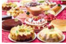
スイーツパラダイス エキスポシティ店 吹田市千里万博公園2-1 らぼーとEXPOCITY 1F