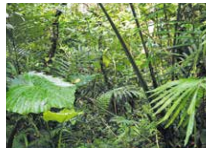
亜熱帯の植物が生い茂る森。様々な昆虫たちが棲息している。