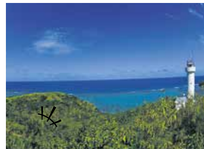
八重山諸島の石垣島。平久保崎灯台の向こうは青い海が広がる。