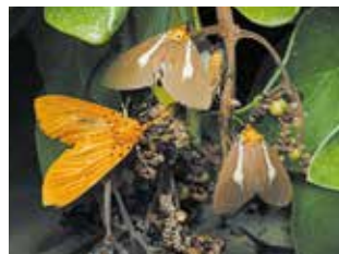
モンバノキに集まる シロスジヒトリモドキ(中央・右) キヒロヒトリモドキ(左) (ヒトリモドキガ科)