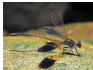
コナカハグロトンボ (ミナミカワトンボ科)