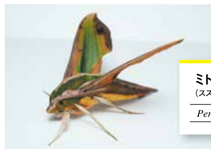
ミドリスズメ (スズメガ科)