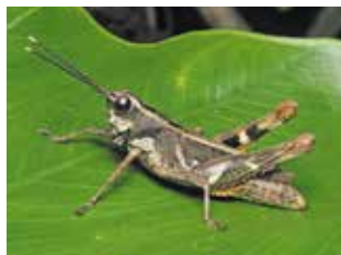
イシガキモリバッタ (バッタ科)

日本列島の最も南にある沖縄県、その最南端に位置するのが八重山諸島です。年間を通じて気温の安定している亜熱帯の地では、私たちが寒さに震えている真冬でも、春のような陽気で木々は青々と茂り、チョウたちが飛び交っています。そんな非日常の世界を紹介することで、身の回りの自然との違いを知り、自然に興味を持つきっかけにしてみたいと思います。